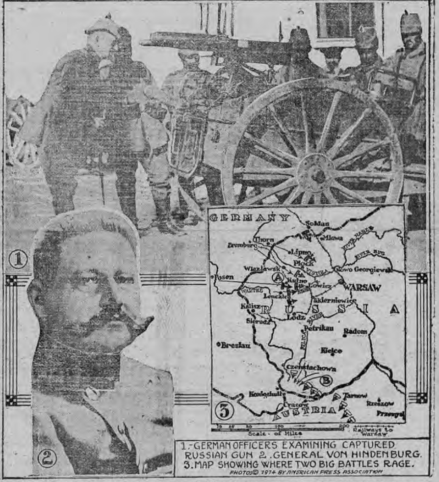
1. GERMAN OFFICERS EXAMINING CAPTURED RUSSIAN GUN. 2. GENERAL VON HINDENBURG. 3. MAP SHOWING WHERE TWO BIG BATTLES RAGE.

El grabado superior muestra a unos oficiales alemanes que examinan detenidamente un cañón capturado a los rusos. El grabado No. 2 muestra al General alemán von Hindenburg, quien tiene el mando supremo de las fuerzas alemanas que operan en Polonia. El grabado No. 3 es un mapa que indica los principales puntos en donde luchan desesperadamente los ejércitos de este General, que se esfuerza por detener el impetuoso avance de los rusos hacia la Prusia oriental.